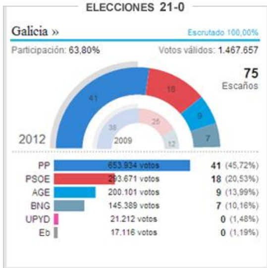
Figura 2. Parlamento galego sen barreira electoral e con circunscrición única.